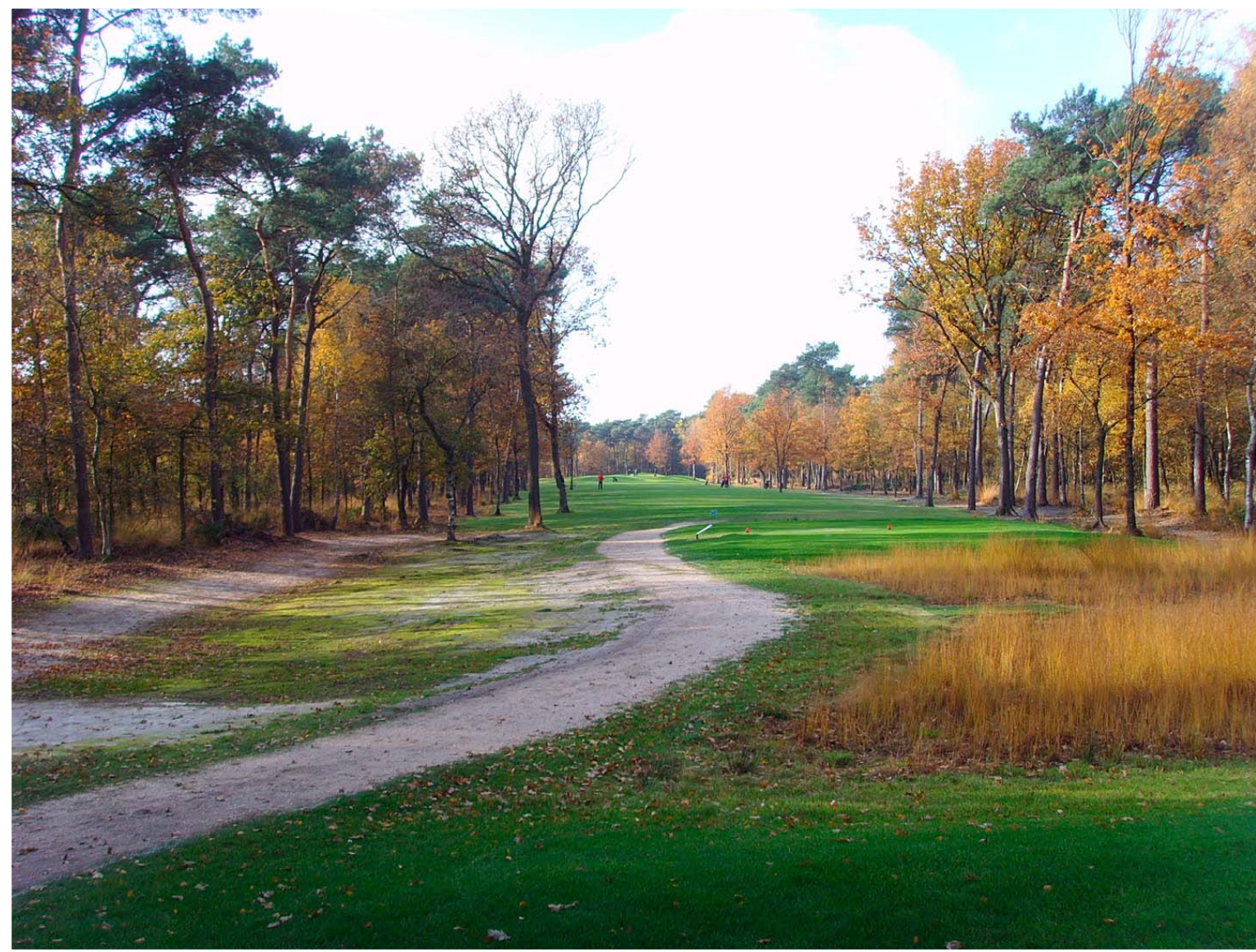
Hole 1, een van de bosholes van Golfbaan het Woold