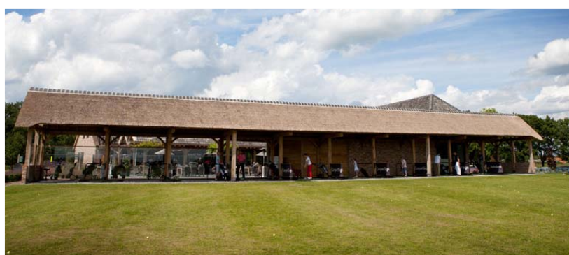
De range van Golfbaan het Woold zit vast aan het clubhuis en heeft ook een rieten dak.