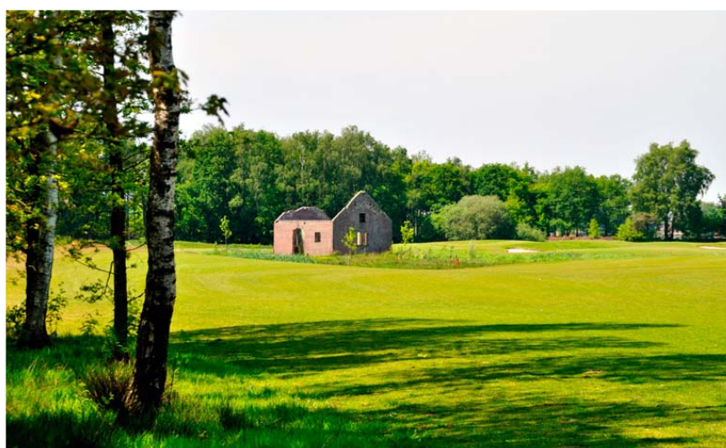
Het Wehrmachthuisje, een minmuseum, staat midden in de baan.